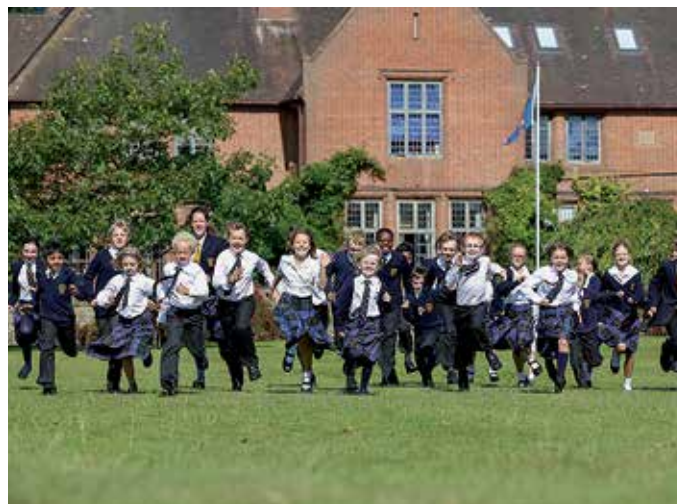
SAY Languages está en permanente contacto con los alumnos y los padres.